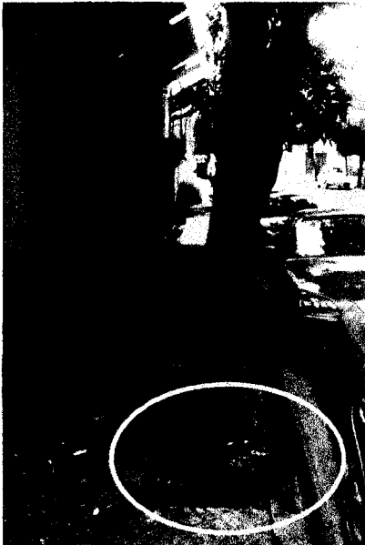
Fotografía 5. Tocón de árbol, se notó que no es reciente el derribo del árbol.