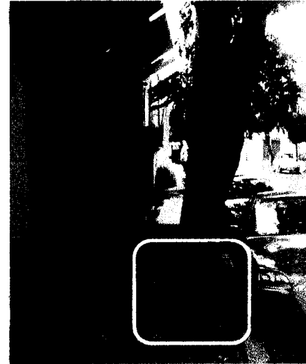
Fotografía 6. Árbol objeto de demanda Fresno ( Fraxinus udhei ) se observa exposición de raíz.