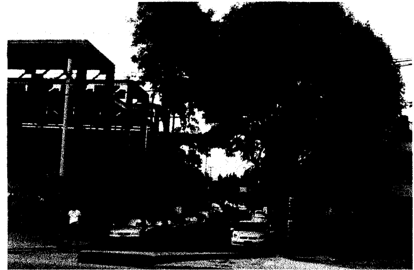
Fotografía 2. Predio vista con esquina Calle Cerro Tezonco, donde se observa presencia de varios árboles.