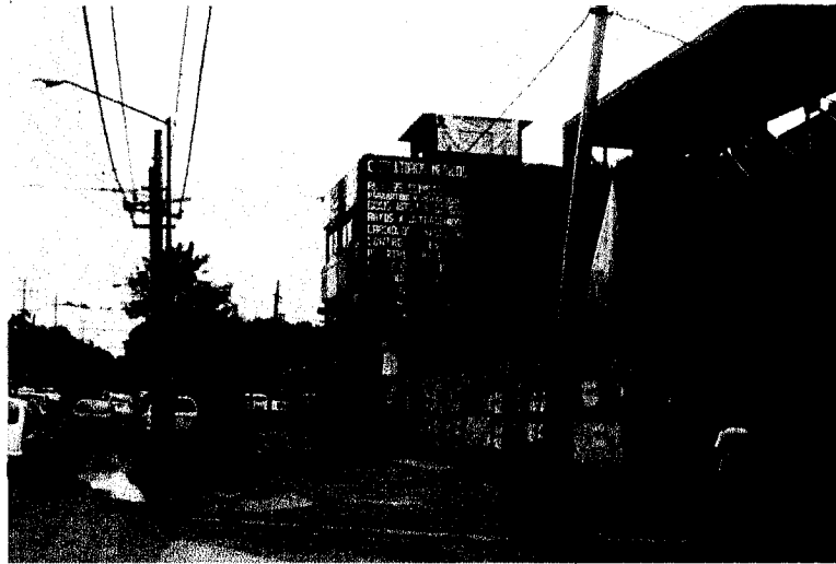
Fotografía 1. Predio vista por Avenida Taxqueña No. 1323, donde se no se observan árboles.