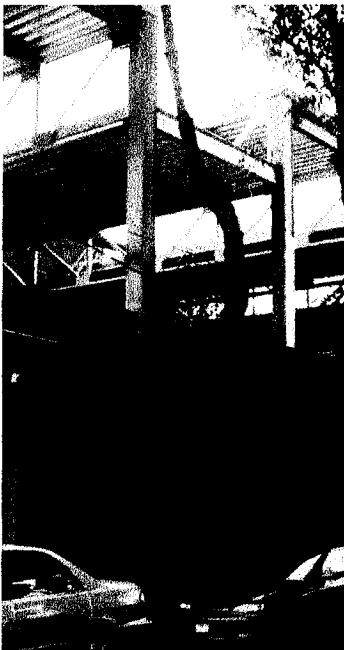
Fotografía 7. Tallo del Fresno ( Fraxinus udhei ).