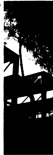
Fotografía 8. Copa del Fresno ( Fraxinus udhei ).